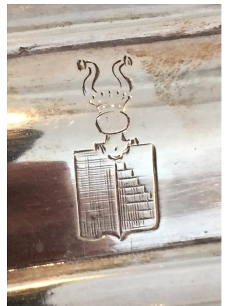
Figur 5. Stampevåben på sølvstige